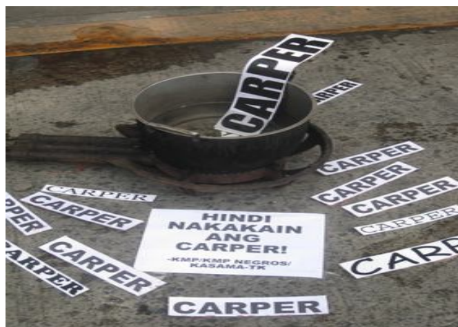
تظاهرات کشاورزان فیلیپینی در روز جهانی غذا

با تشکر فراوان از تمام دوستانی که در تهیه ی این مجموعه، بی دریغ همکاری نمودند.